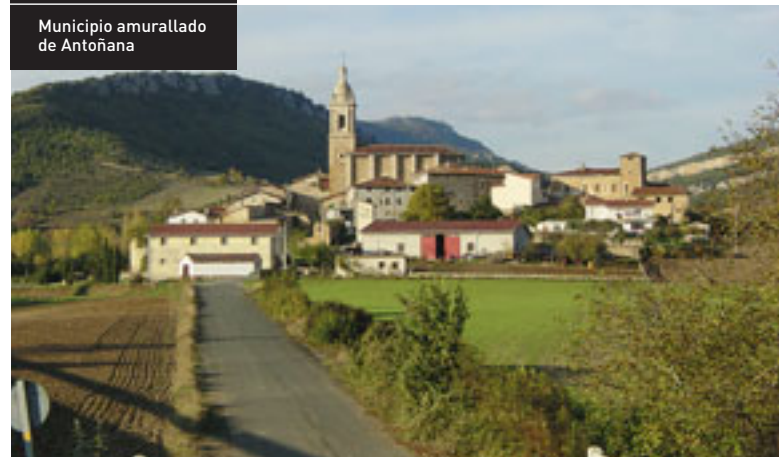
Municipio amurallado de Antoñana