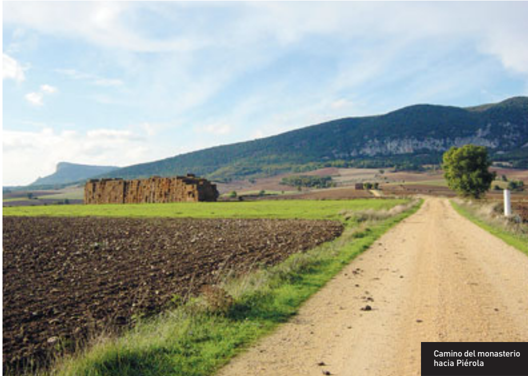
Camino del monasterio hacia Piérola