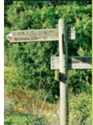
Cruce de caminos situado en el monasterio

El itinerario denominado Sendero Histórico atraviesa la península ibérica de Este a Oeste. Inicia su trazado en Empúries (Catalunya) y lo finaliza en Fraga de Marronda (Galicia). Son alrededor de 1.140 kilómetros. En Álava entra desde Navarra por la Sierra de Lokiz y se extiende hasta Bóveda a lo largo de 179 kilómetros. En ese punto conecta con las tierras de las Merindades pertenecientes a Burgos.