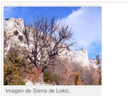
Imagen de Sierra de Lokiz.

El retorno a Ullibarri se realiza por la misma ruta de subida. Es rápida, aunque bastante dificultosa debido a lo resbaladizo de los caminos, cubiertos siempre de hojas secas (2h.20'). Las únicas fuentes que encontraremos en todo el recorrido son las de Ullibarri o la de Alda, si por casualidad nos hemos desviado